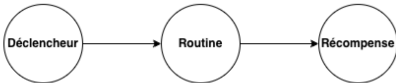
Figure 3: Les trois composantes des habitudes

Nos cerveaux — humains comme artificiels — sont conçus pour repérer des motifs dans l'environnement et y répondre avec d'autres motifs. Ce que nous appelons une "habitude" correspond à l'identification d'une séquence d'événements (motif déclencheur) menant à une routine spécifique (motif comportemental).